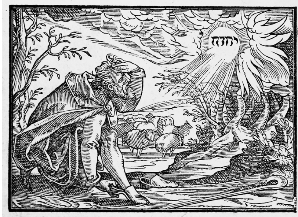
Der Herr erscheint dem Moses im brennenden Dornbusch (Exodus 3,1ff.)

Die Sprachverwirrung von Babel wird durch das sogenannte Pfingstwunder, das in Apostelgeschichte 2 beschrieben ist, aufgehoben.