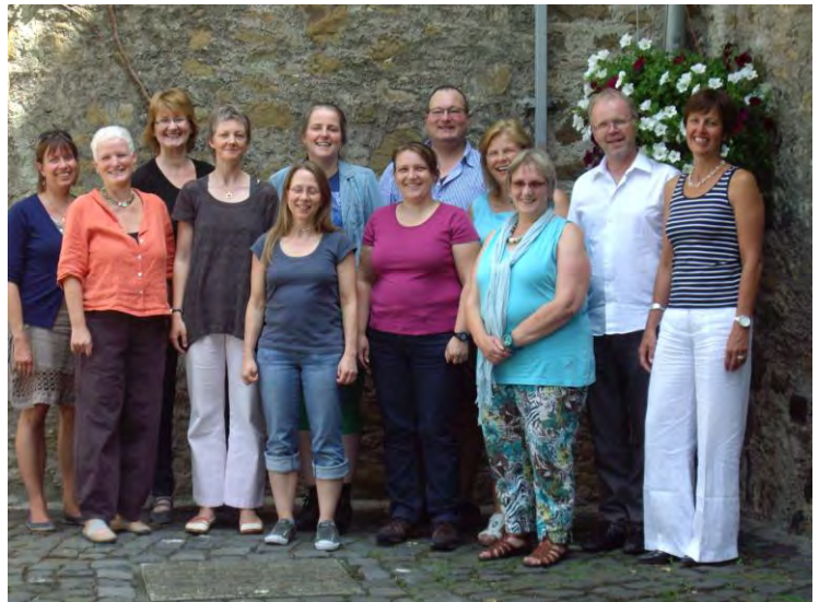
Vorstand des Landesverbandes für Kindergottesdienst In der EKHN